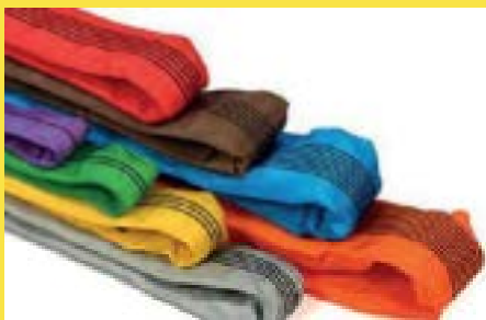
CINTAS DE POLIÉSTER