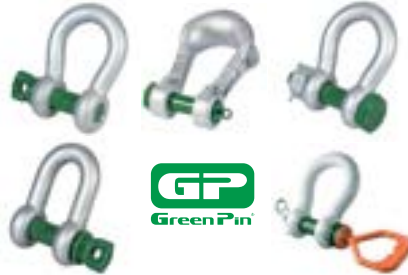
MANILHAS DE CARGA