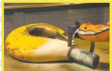
SERVIÇOS DE INSPEÇÃO