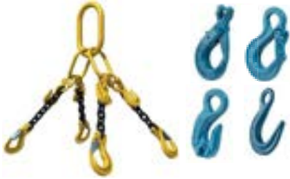
LINGAS DE CORRENTE