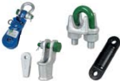
ACESSÓRIOS PARA CABO DE AÇO