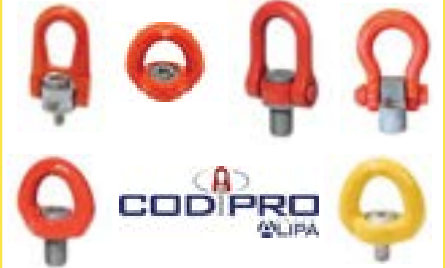
OLHAIS DE IÇAMENTO