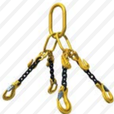
Anéis de Carga