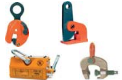
MOVIMENTAÇÃO DE CHAPAS