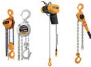
TALHAS MANUAIS E ELÉTRICAS