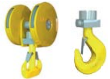
GANCHOS E MOITÕES